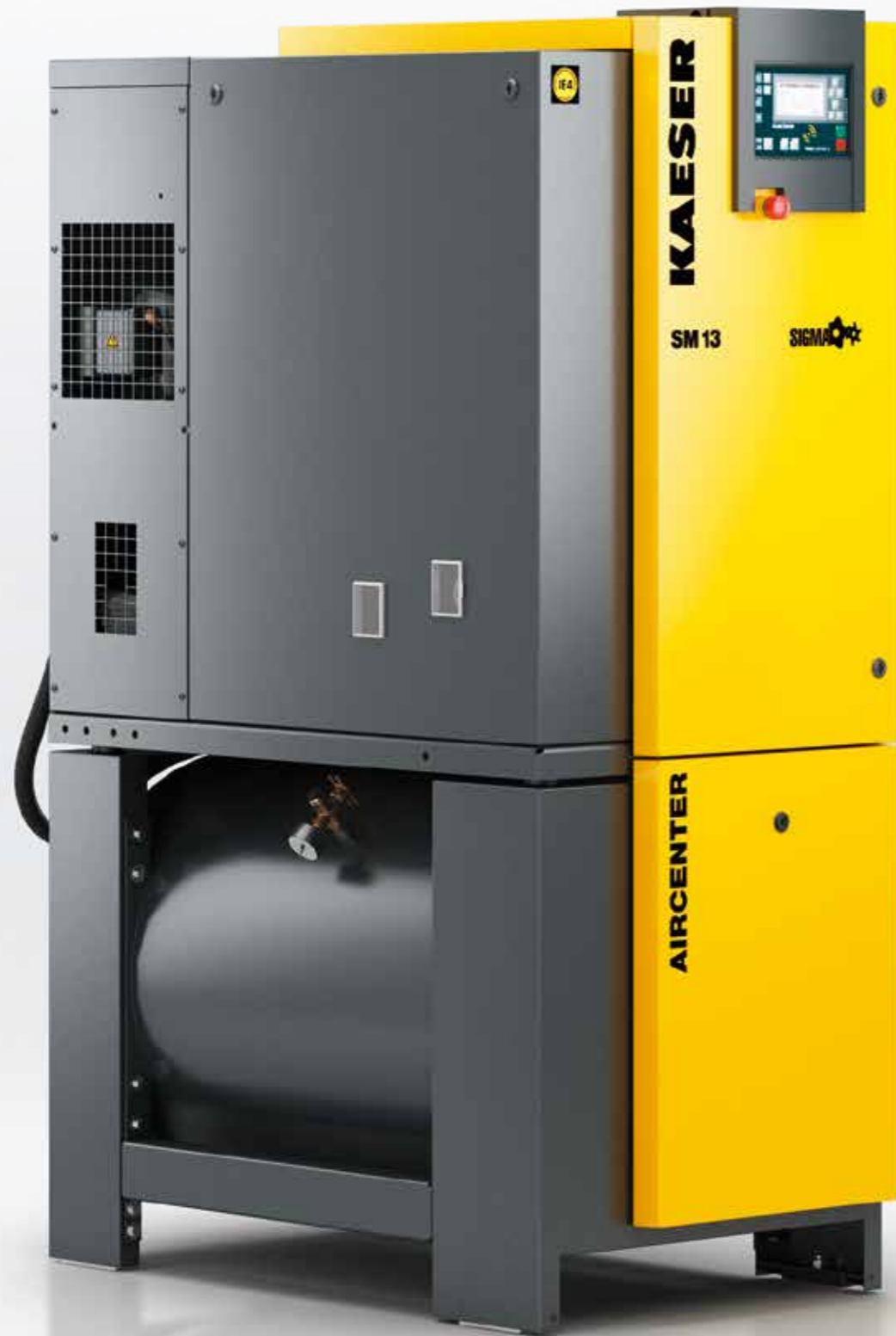
Imagen: AIRCENTER 13