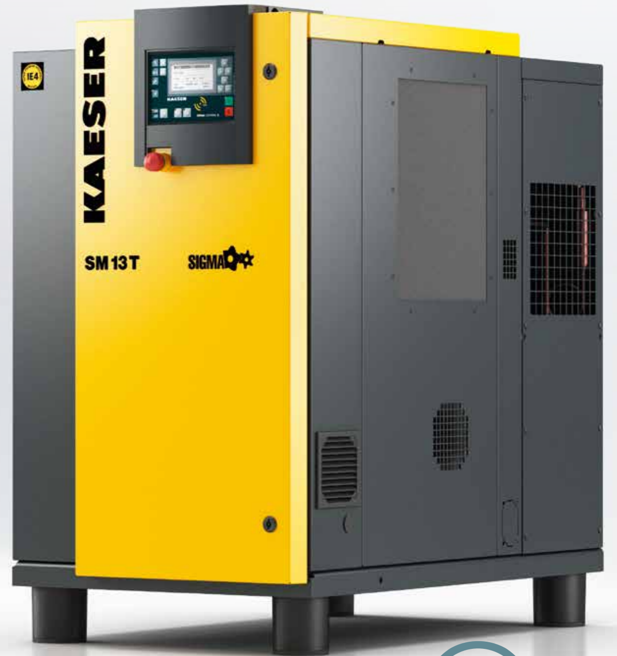
Imagen: SM 13 T

Todos los trabajos de mantenimiento pueden llevarse a cabo desde la misma parte lateral. Para ello, el panel izquierdo de la cabina es desmontable, y desde allí es sencillo acceder a todos los puntos de mantenimiento del equipo.